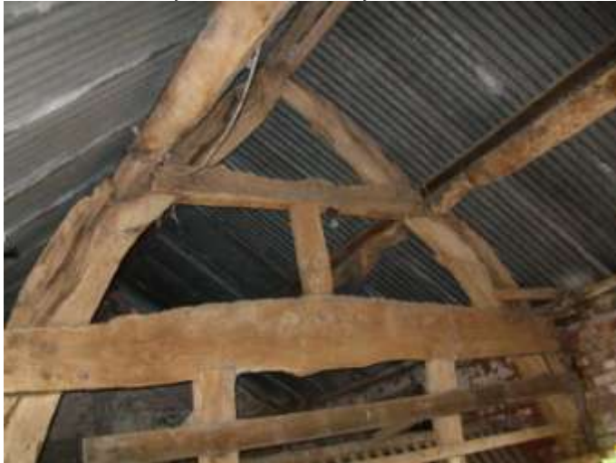
Neuadd nenfforch Sir Ddinbych / Denbighshire cruck hallhouse

neuadd nenfforch yn 1682/3 a daeth yr adain wasanaeth y nenfforch yn barlwr yn 1794. Dyddiadau cymuno tebygol coed Garneddwen Fawr oedd 1557-87. Mae'r rhain a thai eraill yn cael eu cofnodi'n bensaernïol ar hyn o bryd ac mae hanes tua chwe tŷ wethi'n cael eu hymchwilio.