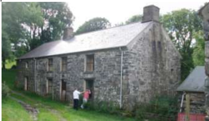
Tŷ Meirionnydd: ymchwil yn y dyfodol / Merioneth house: future research