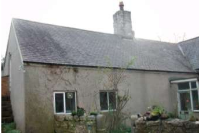
Tŷ Sir y Fflint / Flintshire house: 1557-87

CANGEN MÔN Cyswllt: Peter Masters: 01758 750322 datinggoldwelshhouses@gmail.com . Archebwch yn gynnar gan fod lle yn gyfyngedig; bydd manylion llawn yn cael eu hanfon at y rhai sy'n cael eu derbyn. Dydd Mawrth, Mawrth 6ed: Mewn Cymraeg (addas i ddysgwyr) ymweliad awyr agored am 2yp i Lys Rhosyr, Niwbwrch, o dan arweiniad Rhys Mwyn, i weld safle llys y Tywysogion a thrafod neuaddau Tywysogion Cymru. Nifer mwyaf 20. Gwener 20fed Ebrill ymweliadau 2yp i ddau arall o dai C15 a C16 ym Miwmares. Nifer mwyaf 20. Iau 17eg Mai am 2yp yn Swyddfa Gofnodi Llangefni. Ymchwil, gyda help, tŷ dewisol ar Ynys Môn, neu un o'ch dewis chi. Nifer Mwyaf 12. Llun 11eg Mehefin Ymweliad i Blas Bodafon, Penrhoslligwy: Gwreiddiau C16 a math corn simdde canolog C17. Taith, sgwrs a lluniaeth. Nifer mwyaf 20. Llun 9fed Gorffennaf Ymweliad 2yp i Blas Penmynydd, ger Llangefni. Taith drwy'r tŷ, hanes a lluniaeth. Dathlu digwyddiadau'r flwyddyn; trafod a chynllunio gweithgareddau'r flwyddyn nesaf.