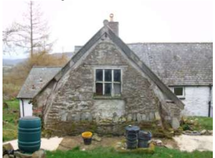
Neuadd Sir Ddinbych / Denbighshire hall-house 1502/03

results were very important. In Ty Gwyn the cruck hallhouse timber was felled in 1447; the screen timbers after 1520 & the chimney stack inserted in 1578. At Hendre the cruck hallhouse timber was felled in 1502/03; the chimney stack inserted in 1586/7; a kitchen added NW of the cruck hall in 1682/3 & the service wing of the cruck range became a parlour in 1794. The likely tree felling dates for Garneddwen Fawr were 1557-87. These and other houses are currently being architecturally recorded and around six house histories are being researched.