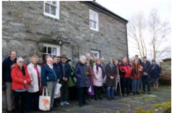
Ymweliad prosiect Sir Gaernarfon/Tesco i Dŷ Fry / Caernarfonshire/Tesco project visit to Tŷ Fry