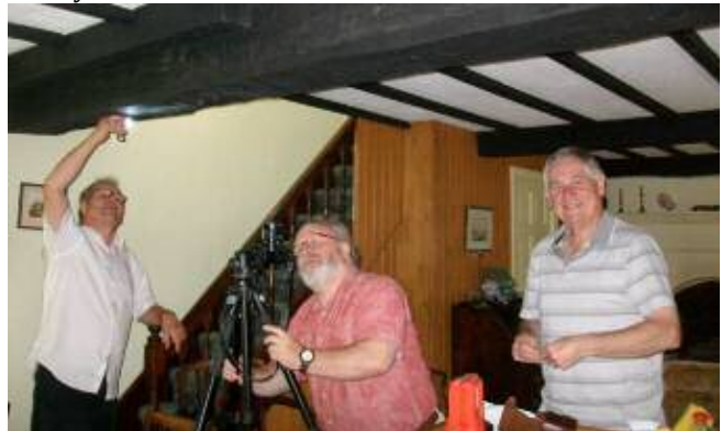
Cofnodi graffiti ar drawst / Recording graffiti on a beam

DO VISIT http://datingoldwelshhouses.co.uk/ to see blog accounts of all recent events and to look at our growing library.