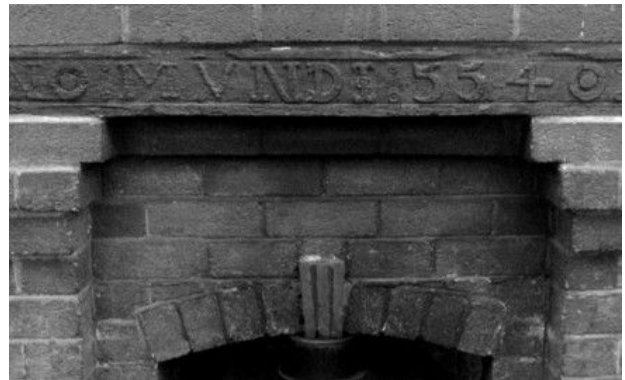
ANNO MUNDI 5540, Tremeirchion

The houses are high status, of stone, with high quality timberwork. The letters and numbers are carved in bas-relief in an elaborate style, with minor variations of ornamentation. Initials of the owners may be included, as well as Biblical warnings or mottoes referring to time passing. The inscriptions are in Welsh, English, and/or Latin.