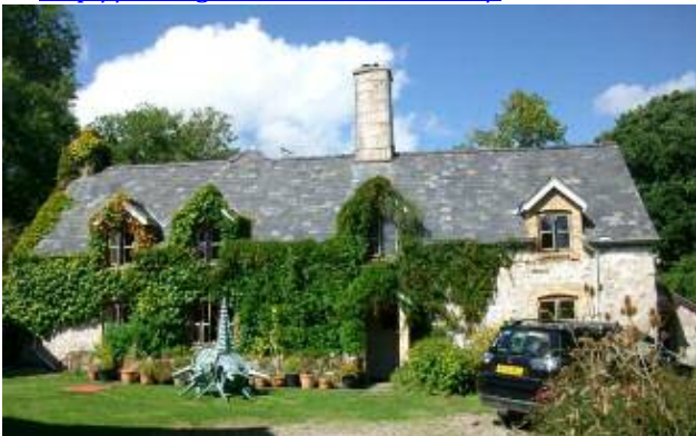
Tŷ neuadd nenfforch a ddarganfuwyd yn ddiweddar / Recently discovered cruck hall house

AR BOB CYFRIF YMWELWCH Â'N GWEFAN ar gyfer gweld adroddiadau blog o'r holl ddiwyddiadau diweddar: gweler http://datingoldwelshhouses.co.uk/ .