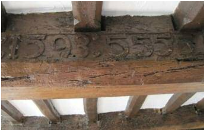
(O.C. / A.D.) 1593, 5555 (A.M.), Bodelwyddan

perchenogion fod yn bresennol, yn ogystal â rhybuddion Beiblaidd neu arwyddeiriau yn cyfeirio at amser yn treiglo. Mae'r arysgrifiadau mewn Cymraeg, Saesneg, a/neu Ladin.