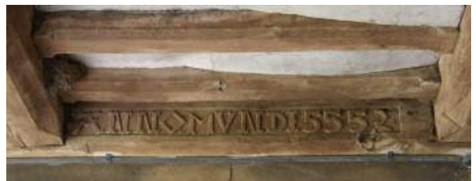
ANNO MUNDI 5552, Neuadd Mostyn / Mostyn Hall

There are several 16th century date inscriptions in the timber of houses in the old counties of Flintshire and Denbighshire which give an A.M. date as well as an A.D. date. 'Anno Mundi' (A.M.) is 'in the age of the world': the number of years since the Creation, based on the Biblical assumption of a world only a few millennia old. There have been numerous calculations giving different A.M. dates. There is a Jewish one and a Byzantine one, and Bede made his own, but the best-known Christian date was published by Archbishop Ussher in 1654 – too late to help here.