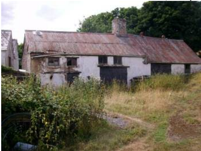
Dyffryn Dyfrdwy 1533/4, a pharlwr 1550/1 / Dee Valley 1533/4 and 1550/1 parlour