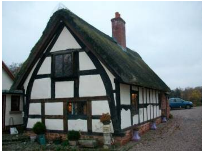
Wrexham – ni ellid ei ddyddio / neither house could be dated.