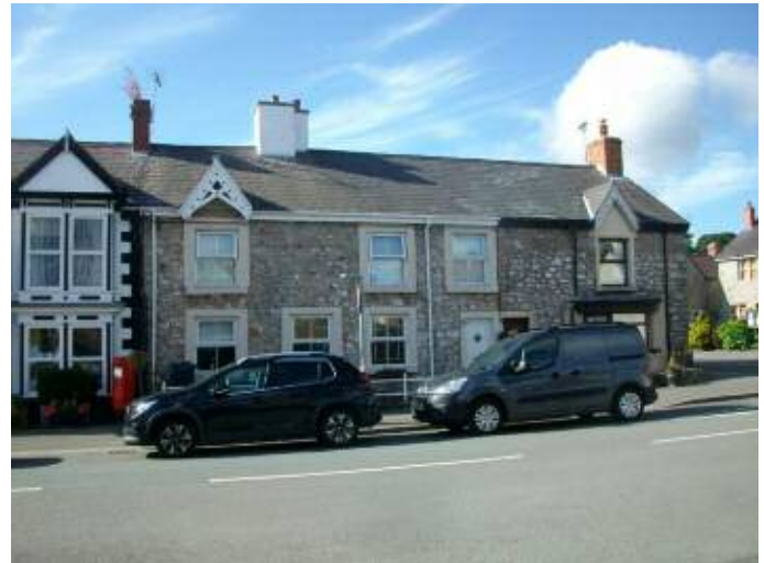
Sir y Fflint, gwanwyn 1465 / Flintshire, spring 1465.