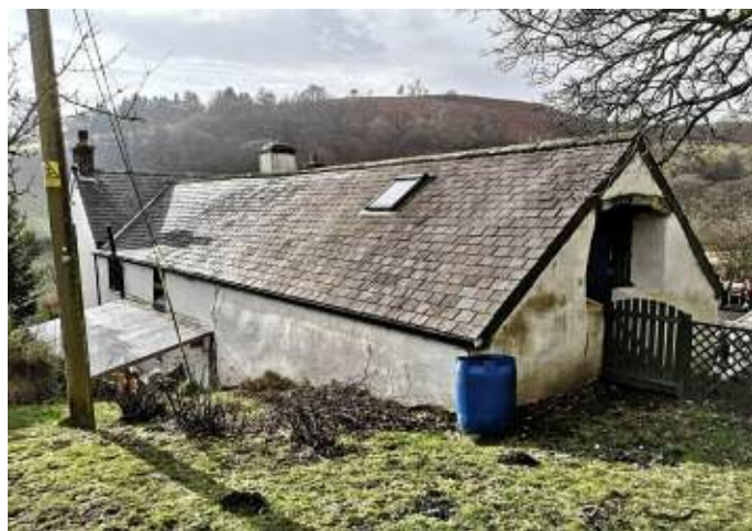
Dyffryn Dyfrdwy – ni ellid ei ddyddio / Dee valley – could not be dated

Thurs 20th June - Visit to Dolwyddelan to see the Tai Penamnen houses (remains of), St. Gwyddelen's church and Elen's well. Meet at 1.00pm at the picnic area near the train station.