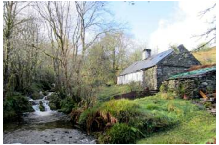
Tŷ gwerinwr? / A peasant house?

Mae'r tai eraill a ymchwilwyd iddynt hyd yh hyn yng Nghonwy a Dyffryn Clwyd, y mwyafrif ohonynt yn fawr mwy na ffermdai mawr, wedi eu codi gan aelodau 1.) o'r uchelwyr Cymreig 2.) disgynyddion y sefydlwyr Seisnig a oedd wedi mewnbriodi i'r uchelwyr lleol 3.) iwryn, ond yn sicr ddigon ddim gan werinwyr. Roedd gan y teuluoedd nifer o ganghennau o gadlanciau ac roedd rhai wedi gallu sefydlu eu stadau bach eu hunain. Eraill, y rhai nad oeddynt cystal eu byd, yn gorfod cael rhywfaint o'u hincwm o ffermio. Buasai hyn wedi eu gwneud bron yn anwahanol i'r iwmon cyfoethocach.