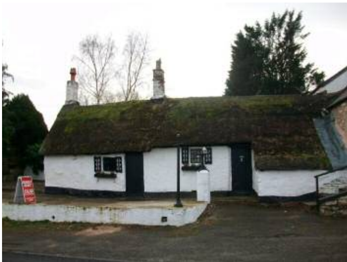
Sir y Fflint – ni ellid ei ddyddio / Flintshire – could not be dated

Mercher 12 Mehefin 2yp Ymweliad â thŷ a chyfarfod yn Nhŷ Cerrig, Rhuthun, dyddiedig hyd at 1501.