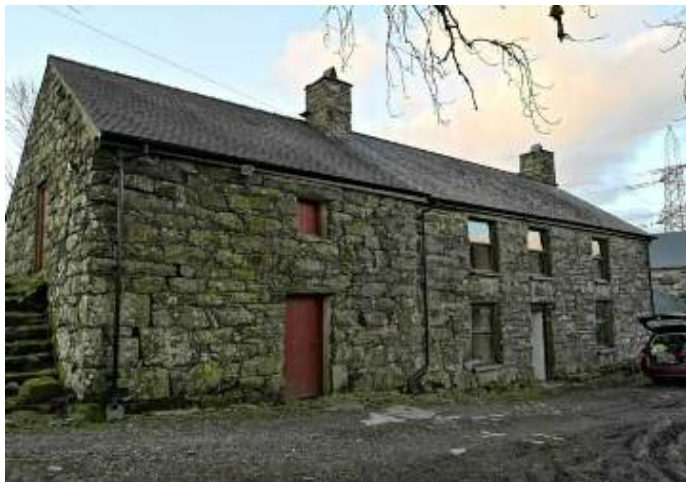
Meirionnydd / Merioneth, 1542-69

Iau Mehefin 20fed – Ymweld â Dolwyddelen i weld gweddillion Tai Penmaen, eglwys Santes Gwyddelen a ffynnon Elen. Cyfarfod am 1.00yp yn y llecyn picnic ger yr orsaf drên.