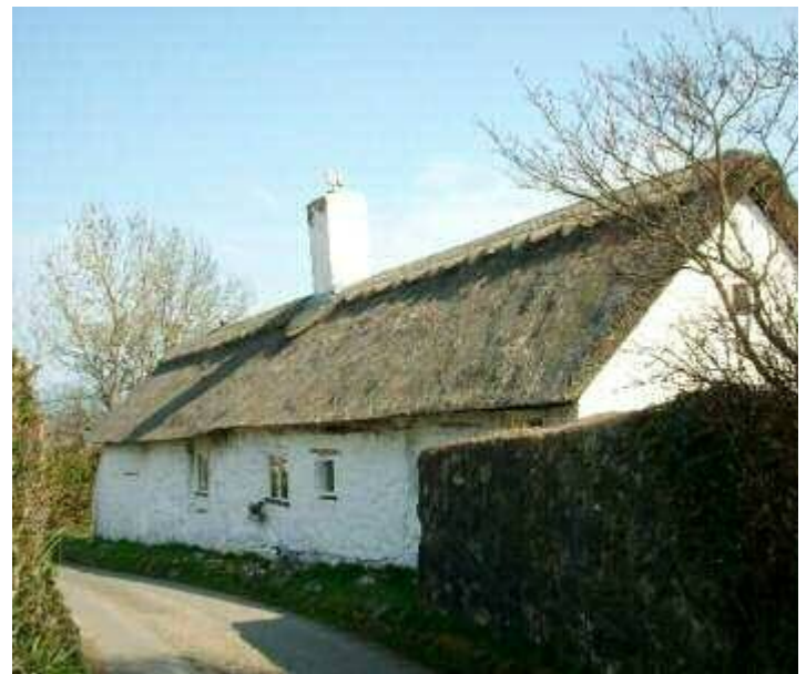
Rhuthun / Ruthin, 1501

Wed 12 Jun 2pm House visit and meeting at Ty Cerrig, Ruthin, dated to 1501.