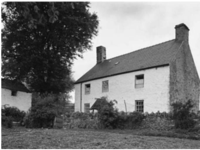
Pwy adeiladodd hwn? / Who built this?