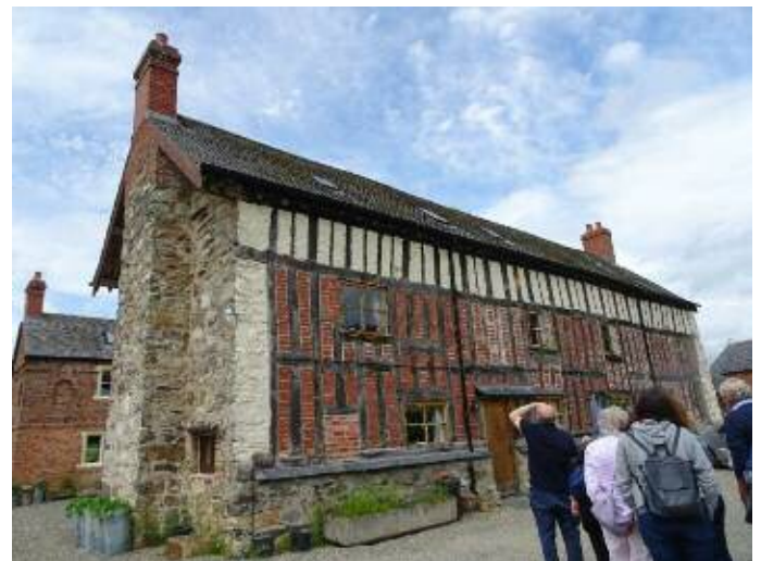
Grŵp yn ymweld â thŷ fferm Elisabethaidd yn Llansilin / Group visit to Elizabethan farmhouse in Llansilin

It has a population of about 700 but the village is very old and parts of St Silin's Church date from the 13th century. Prince Hal sacked the area in 1403 destroying Sycharth which was Owain Glyndwr's settlement about 1 mile south of the village. The motte and bailey of the castle can still be seen.