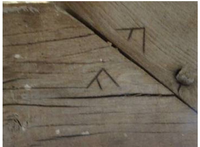
Carpenters' marks/Marciau gosod saer ar goed to yn, Llansilin