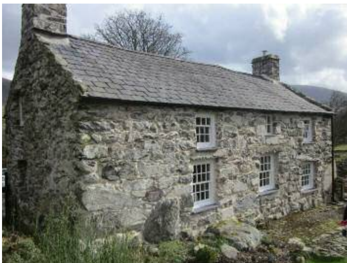
Tŷ math Eryri (1584-5)/ Snowdonia-type house, Llanwnda