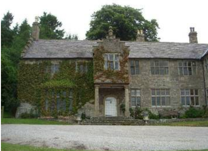
Golden Grove (1578) Llanasa

Hydref 18 Gwener 9.30 yb Arddangosfa 'Sut i ddefnyddio gwefannau perthnasol' Fflatiau Rhos Manor, Llandrillo yn Rhos.