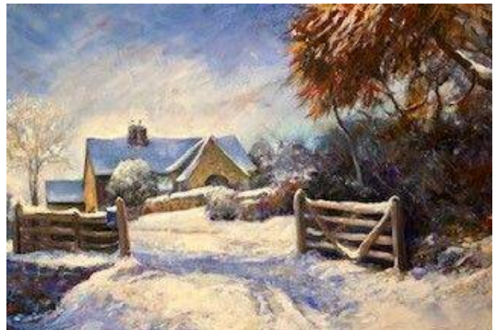
Darlun olew o Ben y Bryn (1485), gan Mary Cunah / Oil painting of Pen y Bryn (1485), by Mary Cunah

As the Llansilin Research Group is only in its infancy it is hoped that outings to other historic houses can be arranged, as well as trips to Archives to help document for posterity the history of this interesting borderlands area.