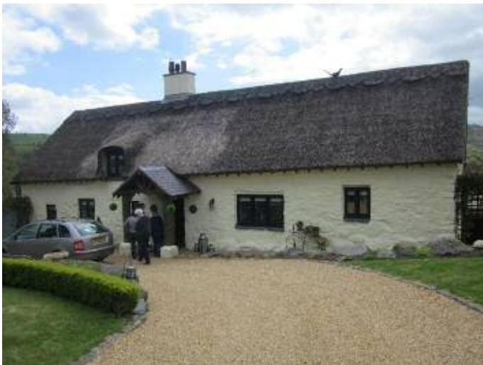
Bwthyn ffrâm nenfforch ym Mryniau Clwyd / Cruck-framed cottage in the Clwydian Range