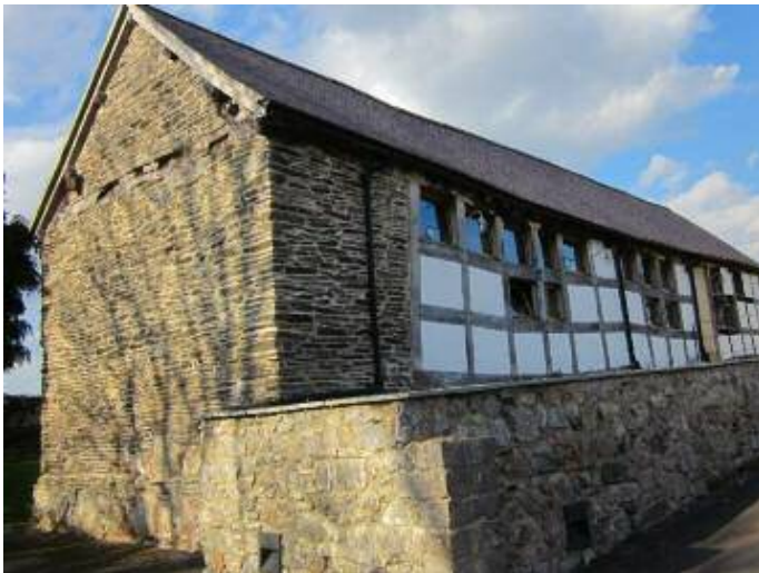
Ysgubor nenfforch wedi ei hadnewyddu yn Llangynhafal, Sir Ddinbych / Restored cruck barn at Llangynhafal, Denbs