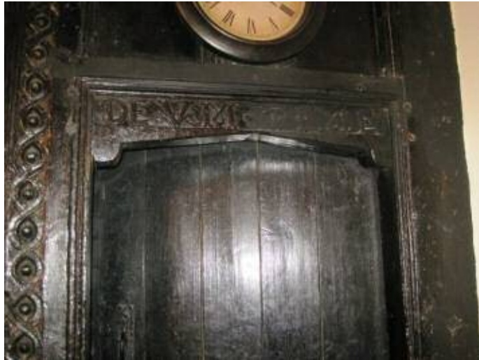
Addurn guilloche, Sir Ddinbych/Guilloche decoration, Denbighshire

Medi 23ain Llu 2yp Ymweld â Phenhyddgan, Ceidio, ger Nefyn. Mae'r tŷ deulawr Gradd II* hwn gyda sgrin mowld guilloche prin ac mae'r cyplysau to cerfiedig yn dyddio i 1573. Nifer mwyaf 15. £2 y pen.