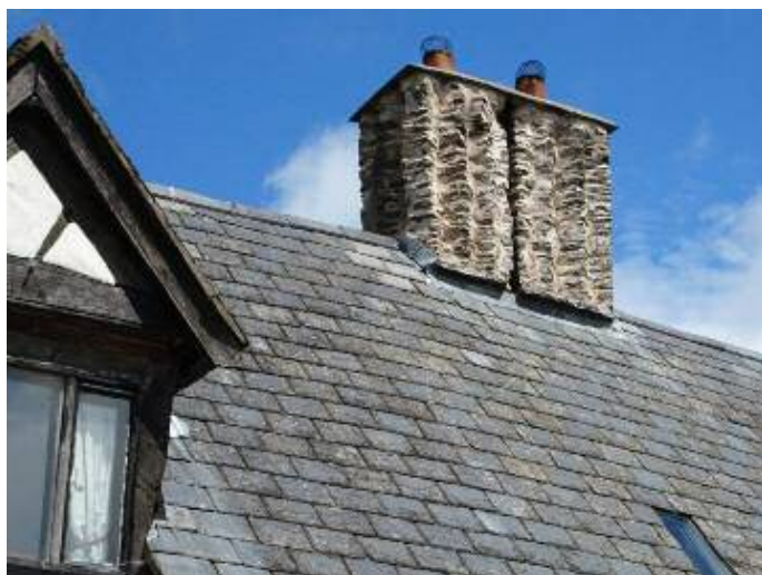
Simnai addurnol/Ornate chimneys, Llansilin

Mae tua 700 yn byw yma ond mae'r pentref yn hen iawn ac mae rhannau o Eglwys Sant Silin yn dyddio o'r 13eg ganrif. Ysbeilliodd Prince Hal yr ardal yn 1403 gan ddinistrio Sycharth, annedd Owain Glyndwr, rhyw filltir i'r de o'r pentref. Mae modd gweld o hyd fwnt a beili'r castell.