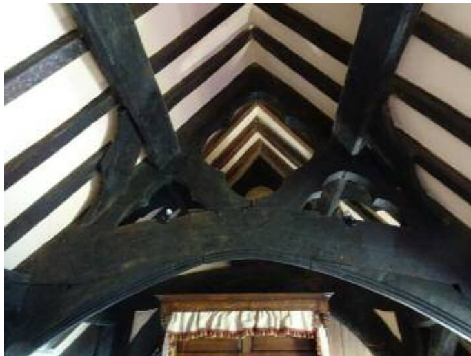
Cyplau'r to/Carved roof-trusses, Llansilin

On 30 th May the research group is entertaining a party from the Denbighshire Branch of DOWH. It is planned to take them to visit Pen y Bryn, dendrodated 1485, and St Silin's Church. There will be a walk around the village and a visit to Ty Newydd which is an Elizabethan Farmhouse in the middle of the valley .