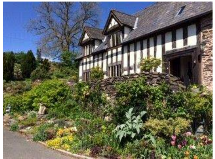
Pen y Bryn (1485), Llansilin

Gan fod Grŵp Ymchwil Llansilin yn ddim ond yn ei fabandod, gobeithir y gellir trefnu teithiau i Archifau ar gyfer dogfennu ar gyfer y dyfodol hanes yr ardal ddi-ddorol hon ar y Gororau.