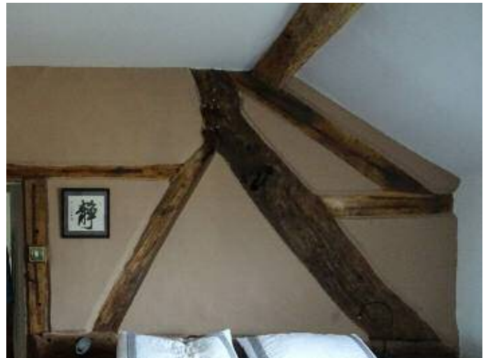
Ffrâm goed a ddaeth i'r golwg yn ddiweddar yng Nghoed-poeth / Timber-framing recently uncovered at Coedpoeth

Sept talk and house visit to be confirmed