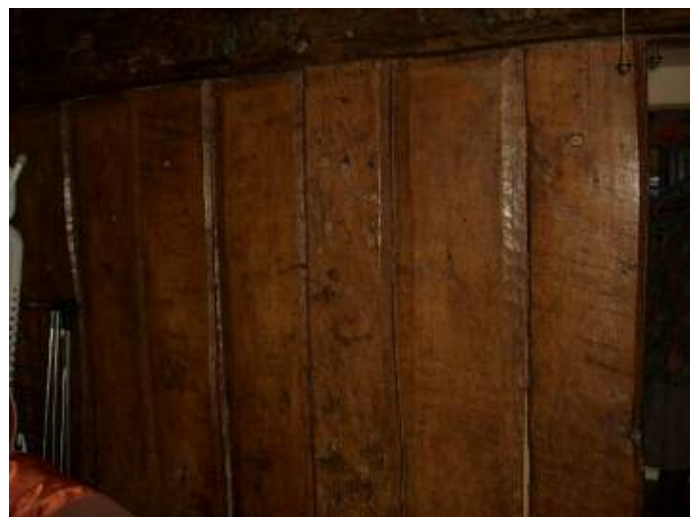
Paneli derw gwreiddiol mewn bwthyn nenfforch /Original oak panelling in cruck cottage

October 18 th Fri 9.30am Demonstration 'How to use relevant websites' Rhos Manor Apartments, Rhos on Sea.