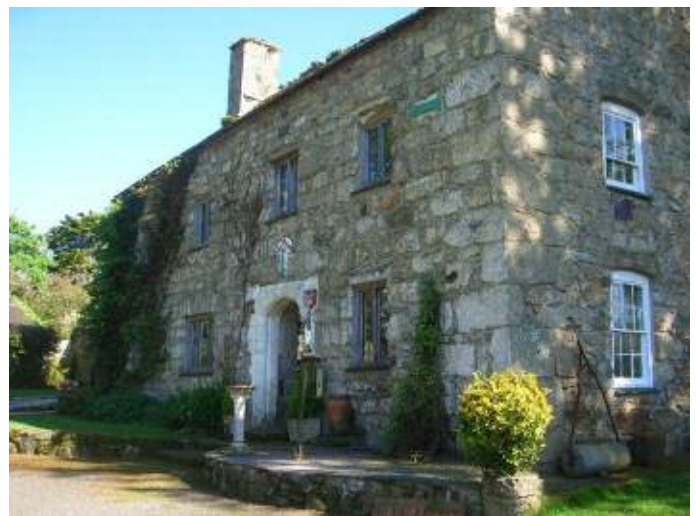
Plas Penmynydd, Ynys Môn / Anglesey