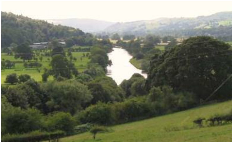
Dyffryn Dyfrdwy / The Dee valley

Heblaw am amaethyddiaeth y dyffrynnoedd ffrwythlon, roedd y bryniau'n darparu ffridd, mawnogydd a llechi; roedd cynhyrchu gwaith gwau a brethyn yn ddiwydiannau pwysig hefyd. Yn y 19 eg ganrif roedd ffordd Thomas Telford, [yr A5 bellach] yn croesi Edeyrnion o'r dwyrain i'r gorllewin gan groesi ei fan lletaf, gan agor y rhan hon o ogledd Cymru i'r byd mawr tu hwnt. Felly roedd Edeyrnion ymhell o fod yn lle marwaidd, tawel ac yn fan ffyniannus ac o ganlyniad adeiladwyd nifer o dai gwych yno.