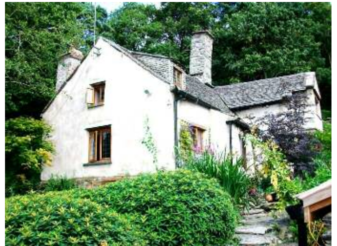
Near / Ger Llangar (dendro 1538)

Apart from agriculture of the fertile valleys, the hills provided upland grazing, turberies and slate; knitting and cloth manufacture were also an important industries. In the 19 th century Thomas Telford's road, [now the A5] crossed Edeyrnion from east to west across its widest part, opening up this part of north Wales to the wider world. So, far from being a quiet backwater, Edeyrnion was a thriving place which led to many fine houses being built.