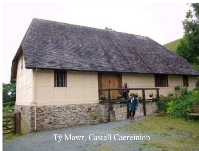
Tŷ Mawr, Castell Caereinion