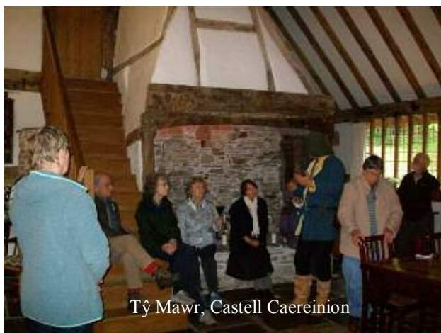
Tŷ Mawr, Castell Caereinion