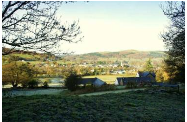
Llandrillo: looking NW / yn edrych i gyfeiriad y gogledd-orllewin

The story of the Barons begins with the death of Madog ap Maredudd of Powys in about 1160. His illegitimate son, Owain Brogyntyn, inherited Edeyrnion, and Owain's three sons Bleddyn, Iorwerth and Gruffydd, each inherited a third of Edeyrnion. Bleddyn inherited Dinmael lands in the north, centred on Rug. The middle covering Llangar, Cymmer and part of Gwyddelwern went to Iorwerth, whilst Gruffydd inherited the southern part centred on and around Llandrillo. Because of partible inheritance these three 'estates' became smaller over the following centuries, but gave rise to a number of quality houses, including Branas Uchaf and Maes Tyddyn, which were successfully 'dendro' dated. A number of other houses in Edeyrnion were considered worthy of 'dendro' dating, but because much of the oak was too fast growing they could not be dated.