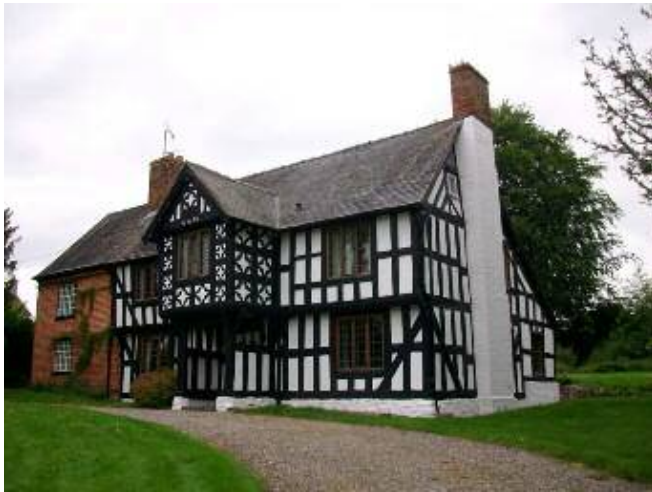
Hen Ficerdy, Aberriw / Old Vicarage, Berriew